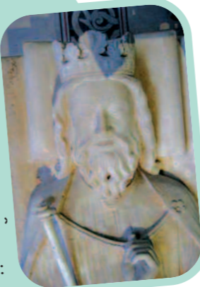
La statue funéraire de Clovis.