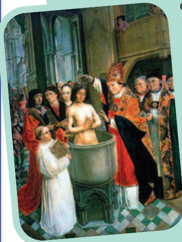
Le baptême de Clovis.