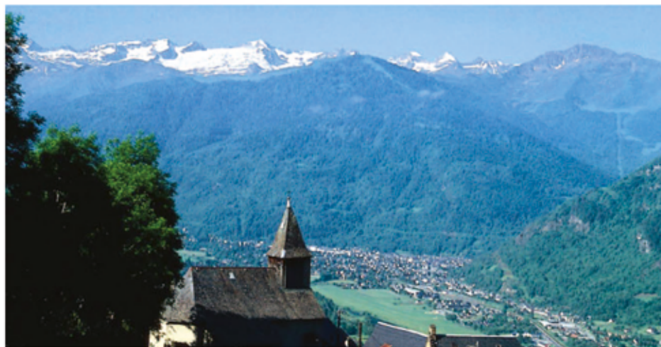
Au cœur d'un paysage magnifique, Luchon bénéficie d'une situation géographique remarquable.