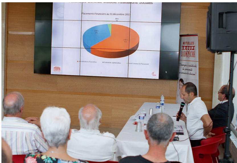
Tous les ans, les adhérents sont appelés à participer et à voter les résolutions lors des assemblées générales et tous les deux ans, comme cette année, ils se prononcent pour le renouvellement du tiers des administrateurs.

Les assemblées générales de vos mutuelles (santé et réalisations sociales) sont le principal lieu de l'expression de la démocratie en mutualité. Durant les Assemblées, les adhérents fixent et valident les grandes orientations de la mutuelle, élisent les dirigeants et sont informés de la manière dont ces derniers se sont acquittés de leurs mandats. Les AG sont un moment primordial pour vos mutuelles qui engagent des actions de prévention, de solidarité et d'entraide. Pour l'équipe dirigeante, c'est un moment de communication incontournable. Les conseils d'administration et les commissions sont des instances dans lesquelles chaque adhérent élu participe directement à la gestion de nos mutuelles.